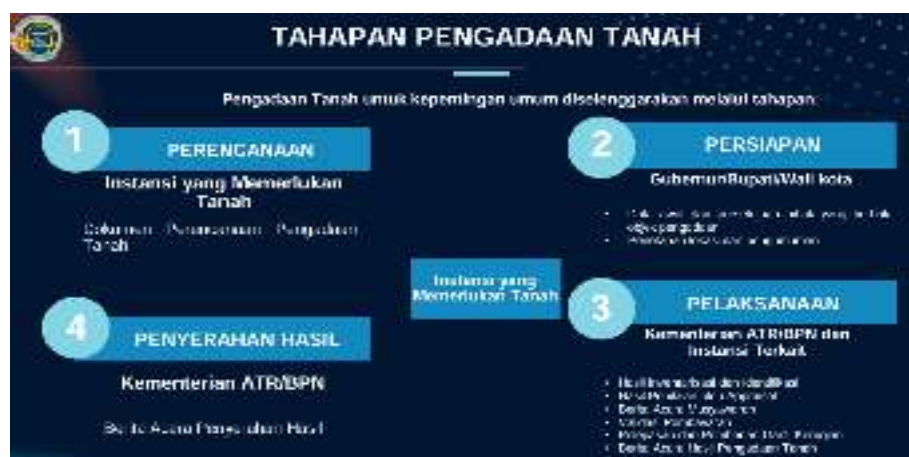
Gambar 1. Tahapan Pengadaan Tanah

Berikut adalah tahapan proses pengadaan tanah menurut aturan yang berlaku.