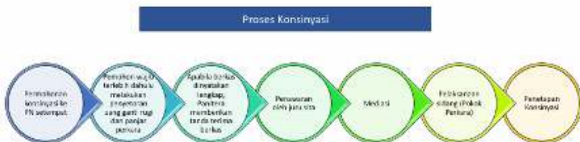
Gambar 4. Proses Konsinyasi

Dalam proses pengadaan tanah PLTA Kumbih terdapat kurang lebih 5,66 ha tanah yang harus dibebaskan melalui mekanisme penitipan ganti kerugian di pengadilan negeri setempat. Penitipan ganti kerugian (konsinyasi) adalah penyimpanan ganti kerugian berupa uang kepada pengadilan oleh instansi yang memerlukan tanah dalam hal pihak yang berhak menolak besarnya bentuk ganti kerugian berdasarkan hasil musyawarah tetapi tidak mengajukan keberatan kepada pengadilan, menolak putusan pengadilan yang telah memperoleh kekuatan hukum tetap, atau keadaan tertentu lainnya. Pelaksanaannya dapat dilakukan sendiri oleh instansi yang memerlukan tanah atau dengan pendampingan pengacara atau dengan pendampingan Jaksa Pengacara Negara.