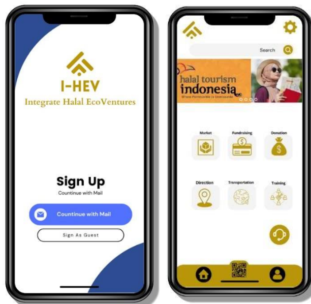
Gambar 3: Prototype Integrate Halal Ecoventures (I-HEV)