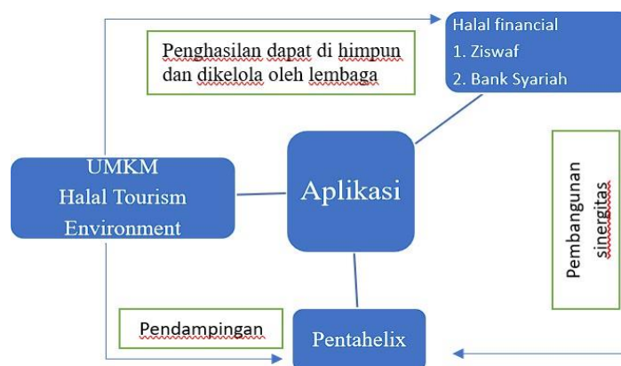
Gambar 1: Konsep Pembiayaan Integrate Halal Ecoventures (I-HEV).

halal di Indramayu. Integrate Halal EcoVentures (I-HEV) adalah aplikasi konseptual berbasis data yang bertujuan untuk memfasilitasi kebutuhan dasar para wisatawan agar dapat menikmati perjalanan wisata halal dengan nyaman. Selain itu, aplikasi ini juga memfasilitasi para stakeholder , seperti pemilik hotel halal, restoran halal, transportasi, UMKM untuk ikut bergabung dalam komunitas atau ekosistem halal dengan menggunakan operasional perusahaan Integrate Halal EcoVentures (I-HEV). Penulis menggagas ide Integrate Halal EcoVentures (I-HEV) sebagai aplikasi penyedia jasa kebutuhan wisata halal friendly di Indramayu.