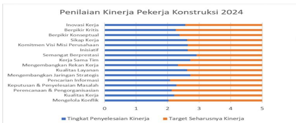
Gambar 1.2 Penilaian Kinerja Pekerja Konstruksi

Berdasarkan gambar di atas, menunjukkan industri konstruksi semakin tahun jumlahnya semakin menurun, akan tetapi jumlah masih dalam kategori sangat banyak. Tren penurunan jumlah perusahaan konstruksi mengindikasikan kemungkinan kinerja perusahaan yang kurang baik, sulit bersaing dengan kompetitor perusahaan lain, atau tidak tercapainya tujuan perusahaan. Tercapainya tujuan perusahaan sesuai dengan yang direncanakan dapat berhasil jika seorang karyawan mempunyai produktivitas atau kinerja yang baik (Fitriana, 2022). Pada salah satu perusahaan konstruksi di Kabupaten Gresik, terdapat permasalahan kinerja pekerja yang belum mencapai standar yang telah ditetapkan oleh perusahaan seperti adanya hasil penilaian kinerja pekerja di bawah ini: