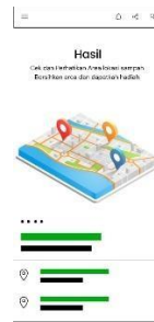
Gambar 1.1 Tampilan Aplikasi Spoting

Dengan demikian, SPOTING tidak hanya memfasilitasi proses pengumpulan sampah, tetapi juga membangun sebuah ekosistem yang saling menguntungkan. Aplikasi ini berpotensi besar untuk meningkatkan tingkat daur ulang di Jawa Tengah dan Indonesia secara keseluruhan, memberdayakan komunitas pengumpul sampah, serta meningkatkan kesadaran dan partisipasi masyarakat dalam mewujudkan ekonomi sirkular.