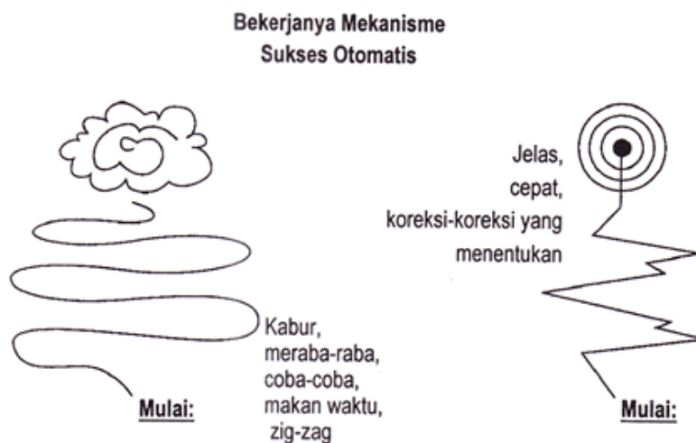
Gambar 1. Iustrasi sistem bekerja servomechanism

Seorang dokter bedah Maxwell Maltz menyebutkan dalam bukunya (Psycho-Cybernetics) menjelaskan bahwa manusia dilengkapi dengan seperangkat alat yang canggih dalam dirinya yang bisa digunakan untuk mencapai tujuan apa saja yang diinginkan, ini semacam rudal yang bisa diarahkan untuk mencapai sasaran yang dituju dengan memberlakukan sistem kontrol otomatis dan sistem koreksi sebagai pemandunya. Namun manusia bukanlah mesin, atau komputer, tetapi dalam pengertian yang sangat nyata, manusia mempunyai mesin sukses yang mirip komputer yang sangat besar dayanya. Otak fisik dan sistem syaraf manusia membentuk mekanisme kontrol otomatis yang digunakan dan yang beroperasi sangat mirip seperti komputer, suatu alat pencapai sasaran mekanis. Otak dan sistem syaraf membentuk mekanisme pencapai sasaran yang beroperasi otomatis untuk mencapai sasaran tertentu, sama seperti sebuah torpedo atau rudal yang mencari sasarannya sendiri. Mekanisme kontrol otomatis yang terpasang pada semua manusia berfungsi sebagai sistem panduan, untuk secara otomatis menyetir seseorang kearah yang benar dalam mencapai sasaran-sasaran yang ditarget atau memberikan respon-respon yang tepat terhadap lingkungan.