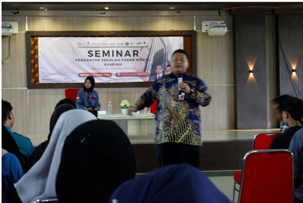
Gambar 1.1 Seminar Pengantar Sekolah Pasar Modal Syariah

Pertama , Seminar Pengantar Sekolah Pasar Modal Syariah bertujuan memberikan bekal dasar pengetahuan tentang pasar modal syariah kepada kalangan mahasiswa dengan narasumber pemateri Bursa Efek Indonesia, MNC Sekuritas dan Otoritas Jasa Keuangan.