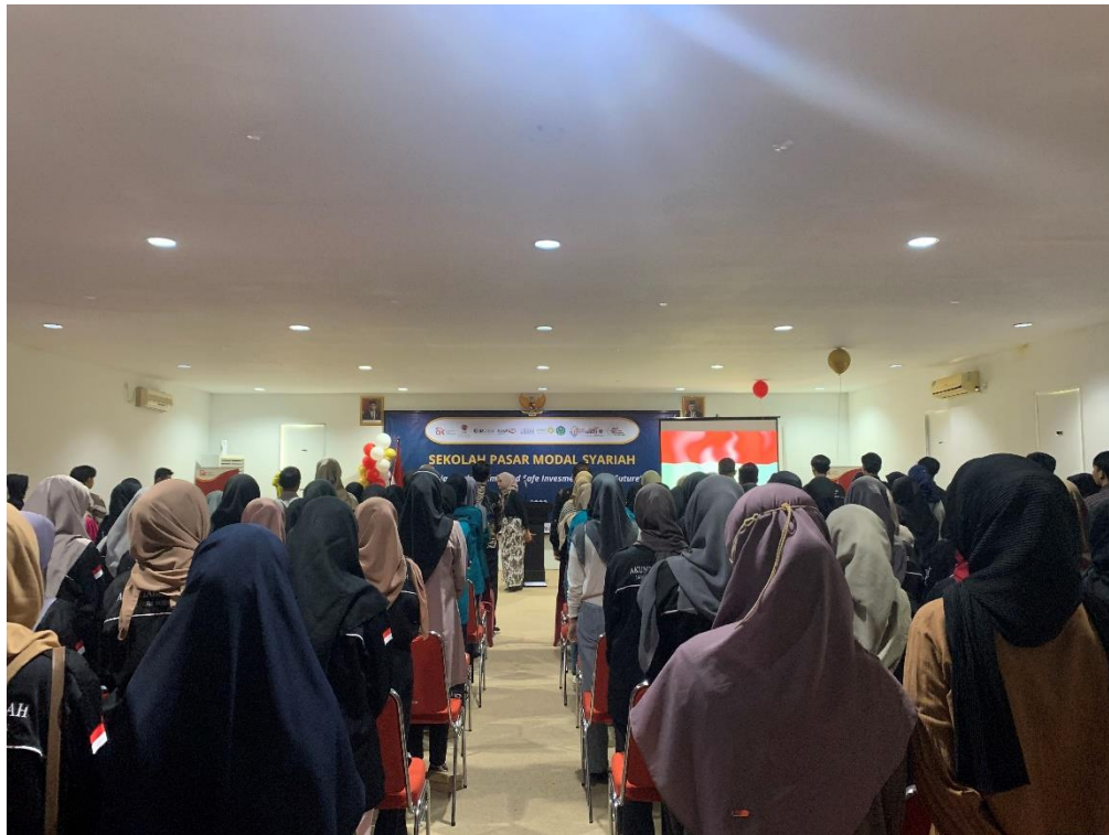
Gambar 1.2 Seminar Sekolah Pasar Modal Syariah Lv 1 & Lv 2

Kedua , Seminar Sekolah Pasar Modal Syariah Lv 1 & Lv 2 bertujuan untuk memperdalam literasi pasar modal syariah terutama saham melalui pembelajaran ananlisis teknikal dan fundamental.