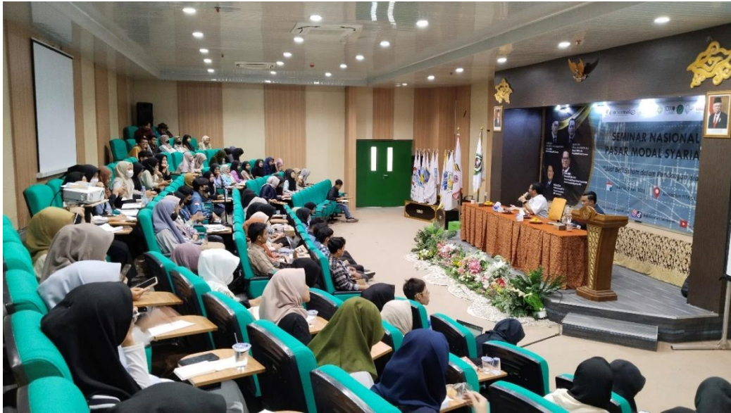
Gambar 1.3 Seminar Nasional Pasar Modal Syariah