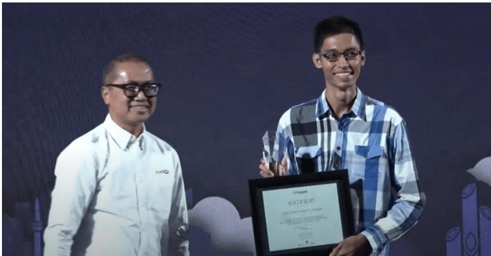
Gambar 3.1 Penyerahan Penghargaan IDX Islamic Kategori Edukasi Investasi Pasar Modal Terbanyak/ Kategori Aktivasi Terbanyak

Kategori lomba yang dapat diikuti diantaranya: 1) Galeri Investasi Syariah (GIS) dengan peserta aktif bertransaksi investasi di pasar modal terbanyak, 2) GIS dengan nilai transaksi investasi di pasar modal terbesar, 3) GIS dengan kegiatan edukasi investasi pada pasar modal terbanyak (kegiatan aktivasi), 4) GIS dengan jumlah investor terbanyak. Perhelatan tingkat nasional yang diselenggarakan BEI tersebut ditujukan untuk seluruh Galeri Investasi Syariah diseluruh Indonesia, kegiatan tersebut pun turut serta diikuti oleh Fakultas Ekonomi dan Bisnis Islam IAIN Cirebon melalui laboratorium pasar modal Galeri Investasi Syariah IAIN Syekh Nurjati Cirebon (GIS-BEI).