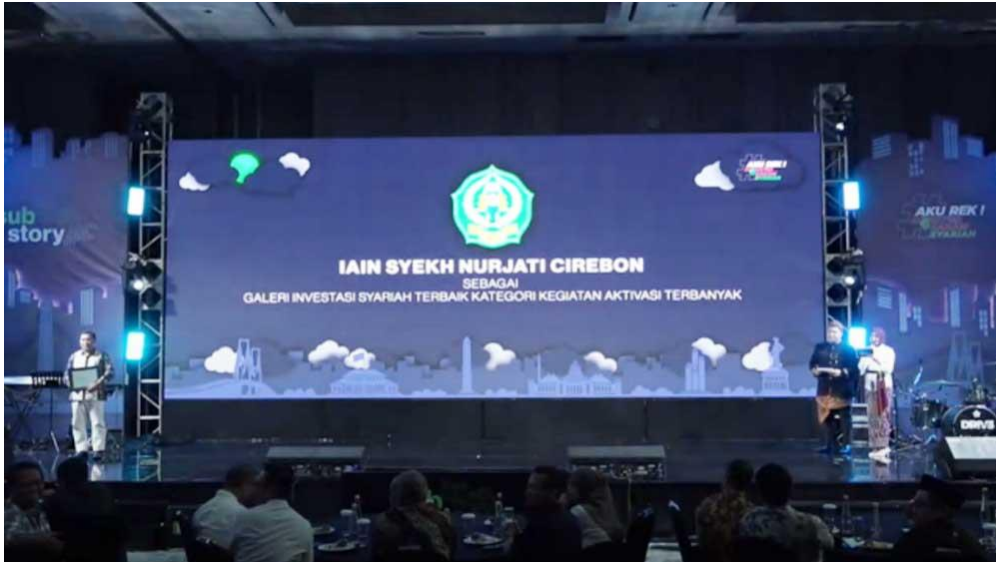
Gambar 3.2 Penayangan Penghargaan IDX Islamic Kategori Edukasi Investasi Pasar Modal Terbanyak/ Kategori Aktivasi Terbanyak

Pemberian apresiasi perlombaan kegiatan IDX Islamic Challenge 2023 telah dilakukan penyerahan bersamaan pada kegiatan roadshow IDX Surabaya Sharia Investor City (SUBSTORY) 2023 bertempat di Tunjungan Grand Ballroom, Doubletree Hotel by Hilton, Kota Surabaya pada Sabtu-Minggu 25-26 November 2023.