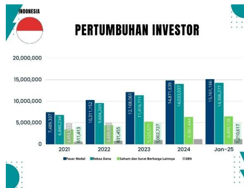
Gambar 1: Grafik Pertumbuhan Investor Indonesia