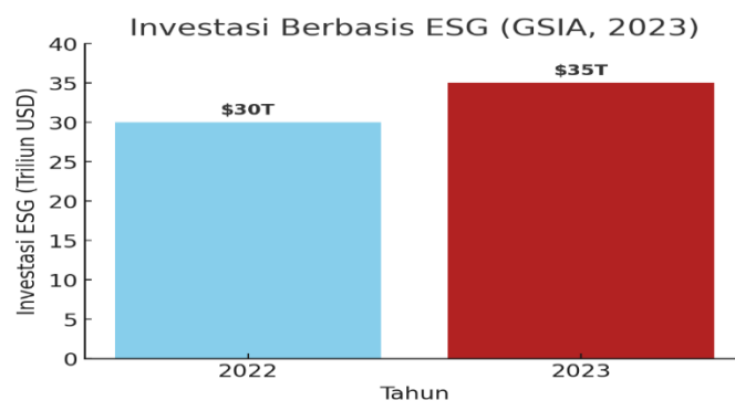
Gambar 1 Investasi Berbasis ESG

Sebuah penelitian oleh Sitorus & Febrianto (2024), menemukan bahwa kesadaran investor semakin meningkat terhadap pentingnya isu keberlanjutan mendorong perusahaan untuk lebih serius dalam mengelola aspek ESG. Investor kini semakin mendesak transparansi yang lebih jelas terkait dampak ESG suatu perusahaan sebelum memutuskan untuk berinvestasi. Tren ini sejalan dengan data dari Global Sustainable Investment Alliance (GSIA, 2023) yang menunjukkan pertumbuhan pesat dana investasi berbasis ESG.