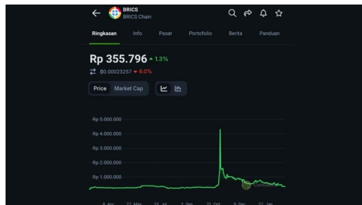
Gambar 2. Nilai Tukar Mata Uang BRICS Dalam 1 Tahun