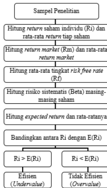
Gambar 2. Kerangka Pemikiran