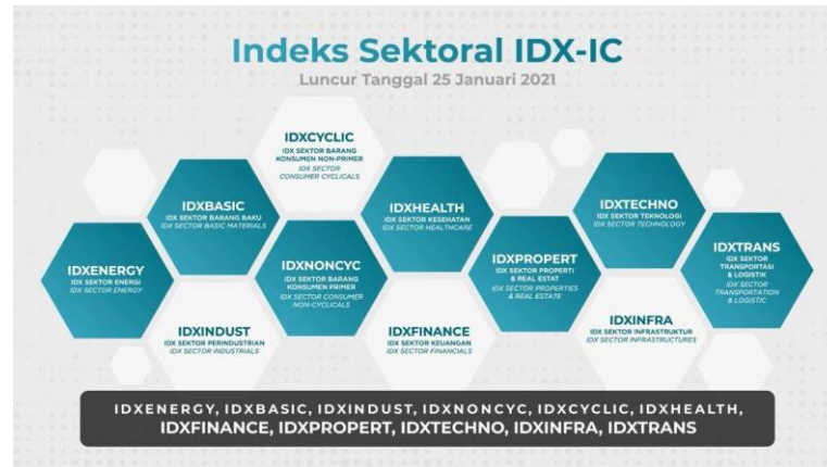
Gambar 1. Klasifikasi Sektor Saham Menurut IDX-IC