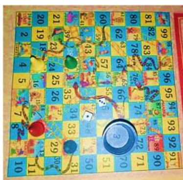
Gambar 3. Media permainan Ular Tangga