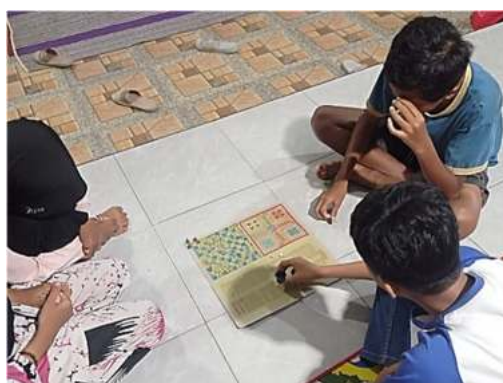
Gambar 2. Observasi permainan ular tangga

Prosedur analisis data dalam penelitian ini yaitu: (1) reduksi, (2) display data (penyajian data), dan (3) mengambil kesimpulan.