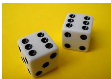
Gambar 4. Mata dadu Ular Tangga

Berdasarkan gambar 4, Konsep geometri pada bangun ruang kubus terdapat pada bentuk dadu yang dapat kita terapkan pada sifat-sifat bangun ruang kubus: