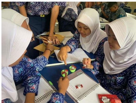
Gambar 1. Proses Pembelajaran Pada Tahap Concrete Mengenali Unsur-Unsur Aljabar

Pada tahap concrete , siswa menggunakan benda nyata yang dapat dimanipulasi. Gambar 1 menunjukkan siswa yang sedang belajar mengenal unsur-unsur aljabar menggunakan permen dan wadah sebagai alat bantu. Dalam kegiatan ini, disediakan sembilan permen, lalu siswa diminta untuk memasukkan permen tersebut ke dalam dua wadah dengan jumlah yang sama di setiap wadah. Setelah dimasukkan, ditemukan bahwa masih ada satu permen yang tersisa. Karena jumlah permen dalam setiap wadah sama, nilai tersebut dapat dimisalkan dengan variabel x , sehingga bentuk aljabarnya dapat dituliskan sebagai 2x + 1 .