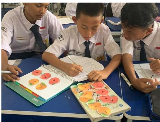
Gambar 2. Proses Pembelajaran Pada Tahap Concrete Penjumlahan dan Pengurangan Aljabar

Pada tahap concrete , siswa menggunakan benda nyata yang dapat dimanipulasi. Gambar 1 menunjukkan siswa yang sedang belajar mengenal unsur-unsur aljabar menggunakan permen dan wadah sebagai alat bantu. Dalam kegiatan ini, disediakan sembilan permen, lalu siswa diminta untuk memasukkan permen tersebut ke dalam dua wadah dengan jumlah yang sama di setiap wadah. Setelah dimasukkan, ditemukan bahwa masih ada satu permen yang tersisa. Karena jumlah permen dalam setiap wadah sama, nilai tersebut dapat dimisalkan dengan variabel x , sehingga bentuk aljabarnya dapat dituliskan sebagai 2x + 1 .