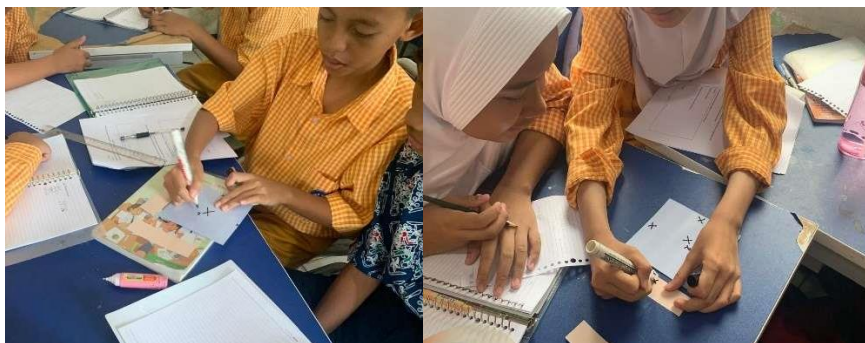
Gambar 3. Proses Pembelajaran Pada Tahap Concrete Perkalian Aljabar

Selanjutnya, siswa belajar mengenai operasi perkalian aljabar. Ditunjukkan pada Gambar 3, siswa menggunakan blok aljabar sebagai alat bantu. Blok yang disediakan berbentuk persegi dan persegi panjang. Karena siswa sudah memahami konsep luas persegi dan persegi panjang, mereka dapat memanfaatkan blok aljabar untuk memahami perkalian dalam aljabar dengan lebih mudah sebelum mengenal sifat distributif pada perkalian aljabar.