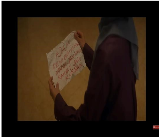
Gambar 4.14 Cuplikan adegan simbol aksi kolektif (teror) Pesan

terhadap pemimpin yang belum menepati janjinya. Dari adanya gebrakan warga, membuat pemimpin sadar akan tugas-tugasnya. Selain itu, mendorong pemimpin untuk menjadi kepemimpinan yang baik bagi warga. Berikut ini adalah adegan simbol aksi kolektif dari warga.