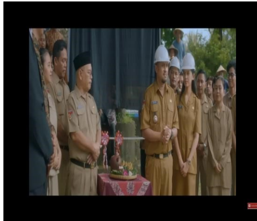
Gambar 4.14 cuplikan adegan simbol pemimpin yang baik