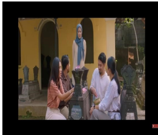
Gambar 4.2 Cuplikan adegan simbol pemimpin sowan ke makam.

yang baik sebagai Kepala Desa. Dapat diartikan bahwa Adam berdoa agar tetap menjadi pemimpin yang amanah untuk melanjutkan kepemimpinan daerah. Berikut ini adalah cuplikan adegan yang menunjukkan simbol sowan pemimpin sowan ke makam.