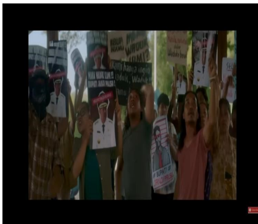
Gambar 4.15 Cuplikan adegan simbol aksi kolektif (Demonstrasi)

Adam pembohong, mana janjimu. Rakyat jadi korban.