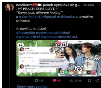
Gambar 1. Tampilan prompt karya AU

pada awal postingan thread , penulis akan mengunggah sebuah postingan sebanyak 4 atau 2 gambar yang disebut sebagai prompt AU untuk mempromosikan karyanya sebelum nantinya akan menjadi sebuah karya AU yang lebih panjang (Ramadhan & Wirajaya, 2024). Berdasarkan pada gambar 1 di atas, penulis @xningiepparkx yang mempublikasikan karya AU berjudul "PEACH EYES LOVE" menampilkan prompt AU-nya dengan desain yang menarik dan penuh warna, penulis juga menambahkan visualisasi dari tokoh utama perempuan dan laki-laki, serta potongan isi cerita. Penulis menggunakan kreativitasnya untuk membuat desain yang menarik sehingga karya AU yang dipublikasikan dapat membangun antusiasme dari calon pembaca dalam waktu singkat.