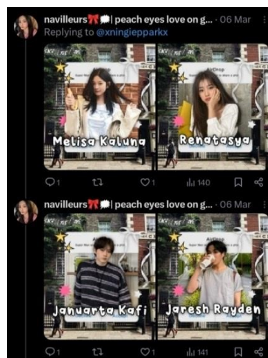
Gambar 2. Tampilan pengenalan tokoh AU

Bagian kedua pada postingan thread menampilkan pengenalan tokoh yang berperan dalam cerita AU. Pengenalan tokoh dibuat sesuai dengan karakteristik dari masing-masing penulis, biasanya ada yang menampilkan informasi tokohnya secara lengkap mulai dari foto idol yang digunakan, nama, hingga kepribadian tokoh. Sedangkan